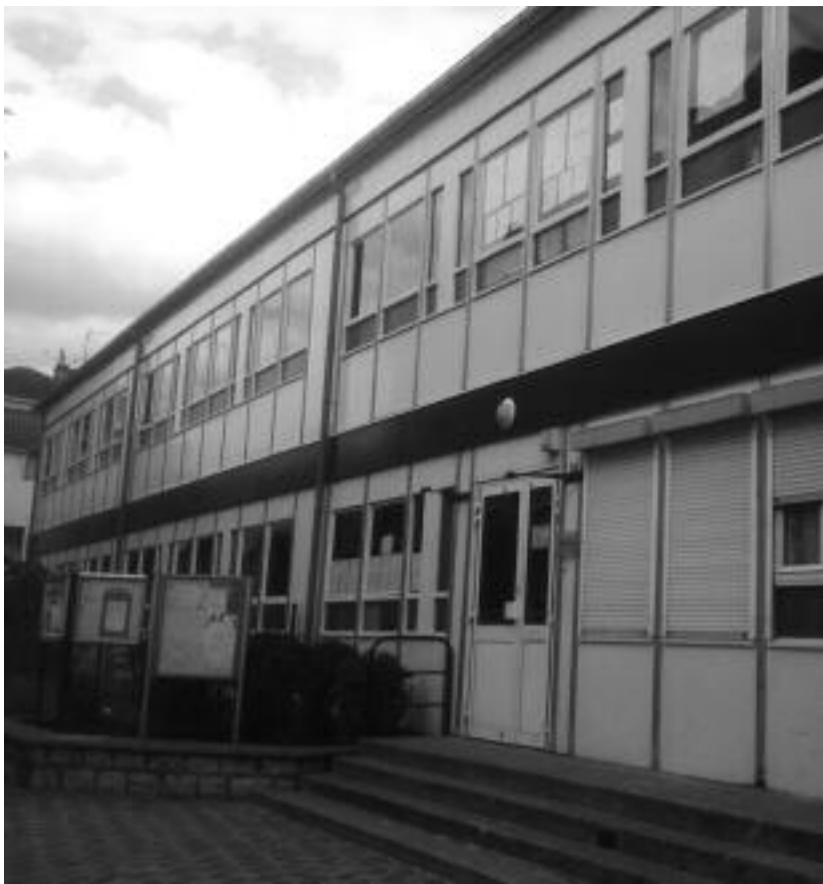
La riante façade de l'école maternelle Bachelet...