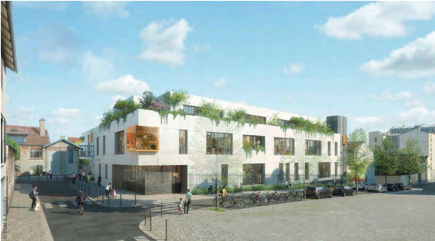
Projet architectural de l'école sur le site Ampère.

S aint-Ouen-sur-Seine est en perpétuelle évolution. Notre population augmente, notre ville se modernise et de nouveaux besoins se font sentir. Accueillir toujours plus de nouveaux habitants est une très bonne chose pour notre commune et prouve, si besoin en était, son dynamisme et son attractivité. Parallèlement, cela nécessite de construire toujours plus de nouvelles infrastructures capables de répondre aux attentes et aux besoins de tous. Ainsi, pour préparer le meilleur avenir possible pour les prochaines générations, il faut de nouvelles écoles. Des écoles bien conçues, modernes et accueillantes, qui donnent envie aux enfants d'apprendre, leur permettent de s'épanouir dans un joli cadre et de garder pour l'avenir de doux souvenirs.