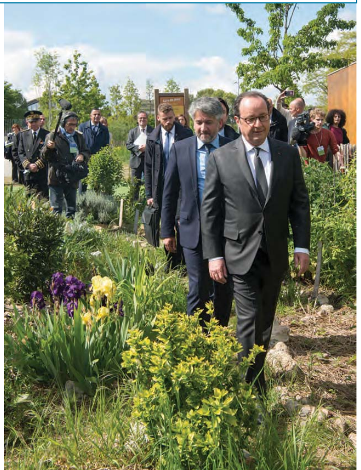
Le maire a invité le président Hollande à découvrir les jardins ouvriers.

À l'issue des allocutions officielles, en sortant de la Serre pédagogique, le président de la République a visité les jardins partagés, guidé par le maire. Cette promenade non prévue dans le protocole lui a permis d'apprécier cet autre aspect de Saint-Ouen qu'il affectionne. ■